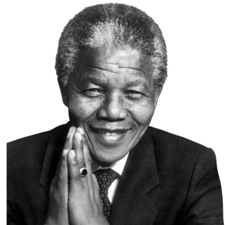
Nelson Mandela 1918-2013

Dig Dig Digging in the sun Men must work for me (x 4)