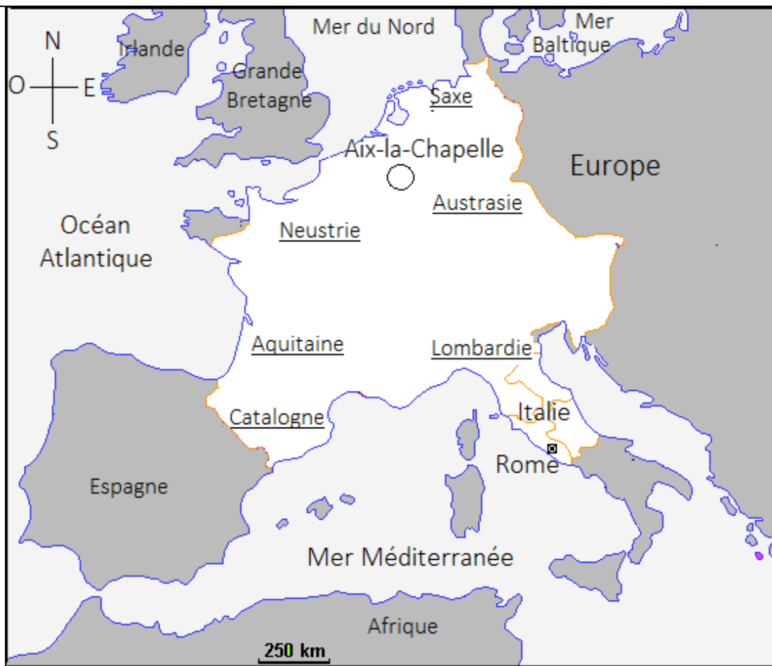
Titre : L'empire de Charlemagne en 814 (Empire carolingien)