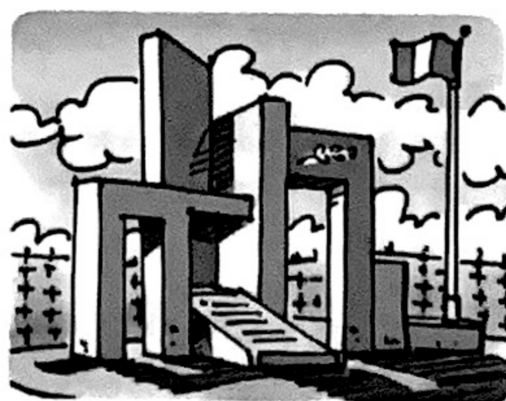
Besoin de se souvenir