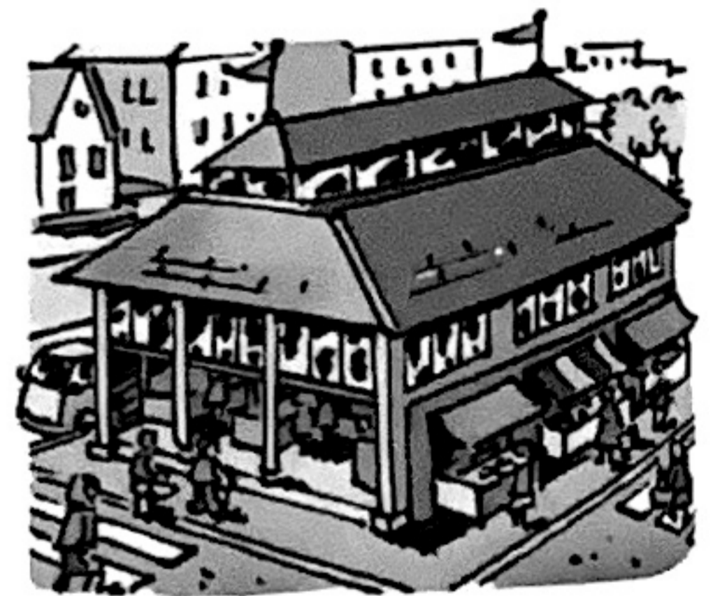
Besoin de faire du commerce