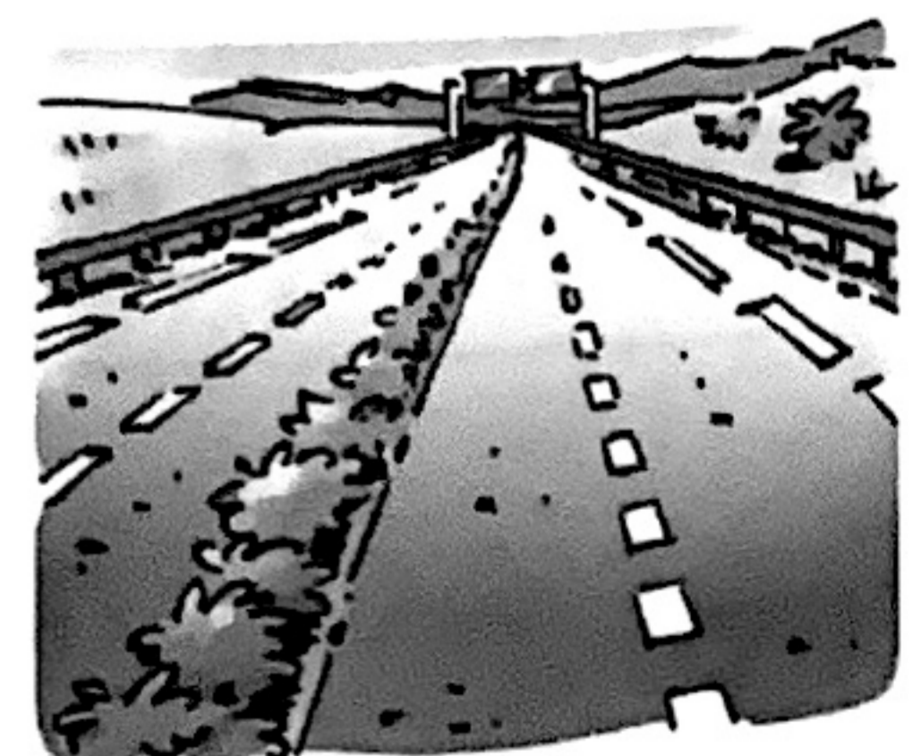
Besoin de se déplacer