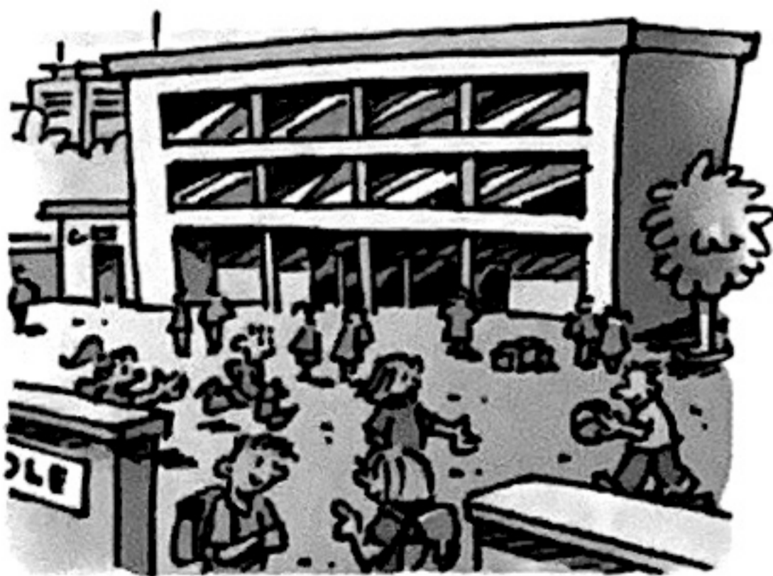
Besoin d'éduquer les enfants