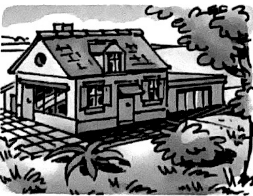
Besoin de se loger